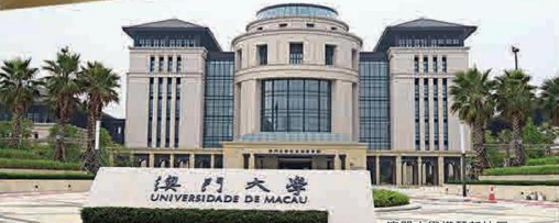
澳門大學橫琴新校區